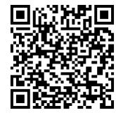
เงื่อนไขการจำหน่าย

สำนักพัฒนาตลาดตราสารหนี้ สำนักงานบริหารหนี้สาธารณะ โทร. 0 2271 7999 ต่อ 5809/ 0 2265 8050 ต่อ 5307