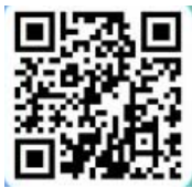
ดาวน์โหลด Bond Direct App Bond Direct

ทั้งนี้ สบन. ได้แจ้งให้ธนาคารตัวแทนจำหน่ายปรับวิธีการจองซื้อพันธบัตรออมทรัพย์ให้เหมาะสมกับสถานการณ์และมาตรการการป้องกันการแพร่ระบาดของไวรัสโควิด-19 ของรัฐบาล เพื่อให้ผู้ลงทุนสามารถทำธุรกรรมได้อย่างปลอดภัย ซึ่งผู้ลงทุนสามารถติดต่อสอบถามรายละเอียดเกี่ยวกับเงื่อนไขและวิธีการซื้อพันธบัตรออมทรัพย์ผ่านช่องทางต่างๆ ของธนาคาร รวมถึงการใช้งาน BOND DIRECT Application จาก สบน. ซึ่งผู้ลงทุนจะสามารถเข้าถึงพันธบัตรออมทรัพย์ได้อย่างสะดวกสบายผ่าน โทรศัพท์มือถือ โดยเลือกไปชำระเงินที่สาขาธนาคารหรือผ่าน Krungthai NEXT ได้