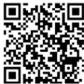
คลิปวีซีดี การใช้งานBond Directพันธบัตรออมทรัพย์รุ่นพิเศษ